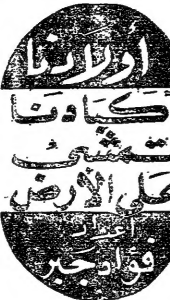
سدهات سبيع حسين